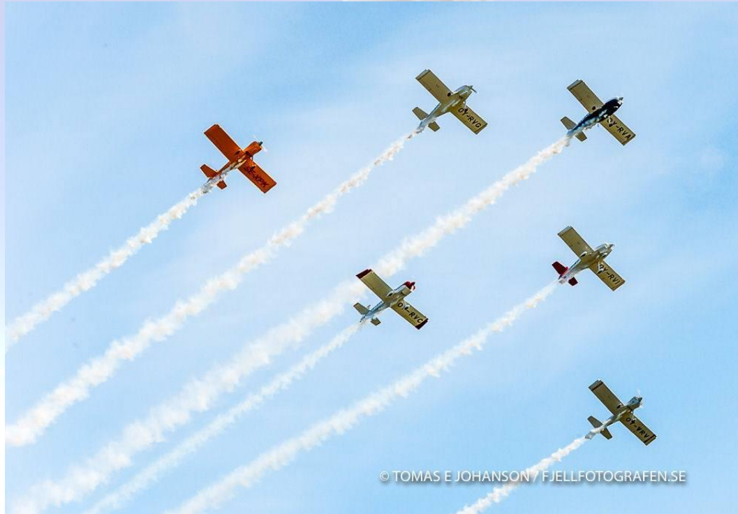
RVators-6-grupp Vans RV